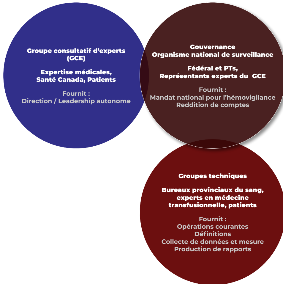
Figure 5. Une configuration possible d'un modèle FPT collaboratif coordonné au niveau fédéral pour un système national renouvelé d'hémovigilance des receveurs

La Figure 5, à la page 45, a été proposée comme configuration possible d'un modèle de gouvernance pouvant répondre aux besoins et aux considérations d'un système d'hémovigilance renouvelé.