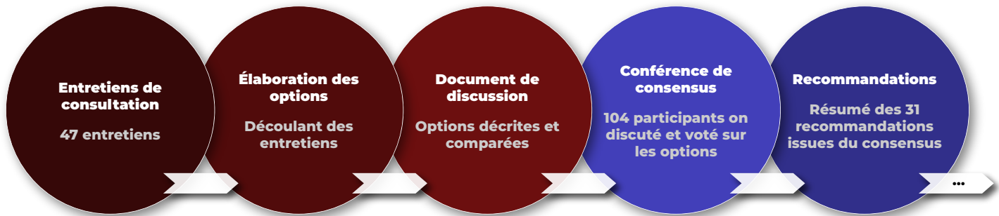
Figure 2. Le processus de renouvellement du système canadien d'hémovigilance des receveurs.