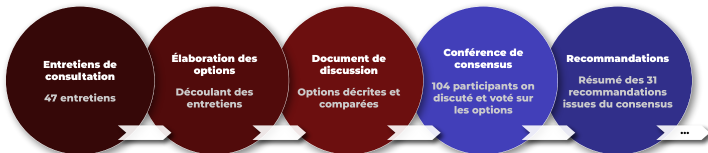
Figure 4. Le processus de renouvellement du système canadien d'hémovigilance des receveurs.

Afin de s'assurer que les participants à la conférence partageaient une compréhension complète du contexte des options qu'ils allaient examiner, le Document de discussion a passé en revue des informations contextuelles essentielles sur les activités d'hémovigilance au Canada, ainsi que sur les attentes et les pratiques exemplaires susceptibles de servir de modèles pour un système canadien renouvelé. Ces informations contextuelles comprenaient les éléments suivants :